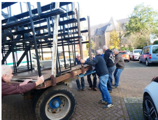
Woensdag: de stellingen arriveren bij de zaal.

zoals vroeger. En op vrijdagavond werd ook nog eens bekend gemaakt dat de horeca vanaf de volgende dag om 20.00 uur dicht moest. Die altijd gezellige zaterdagavond konden we toen mooi op onze buik schrijven. En ook kon er meteen een streep gezet worden door het traditionele pannenkoekendiner op zondagavond. Ondanks deze tegenvallers werd de enveloppenactie tegen alle logica in toch een groot succes. Soms kun je niet alles verklaren, zie je wel. Achteraf hebben we er alles uitgehaald wat er in zat. Het was een aparte ervaring, de corona-tt van 2021. Natuurlijk zijn er verbeterpunten. Daar wordt aan gewerkt zodat de tt van 2022 nog strakker zal gaan verlopen. De volgende foto's geven een korte impressie weer van de tt.